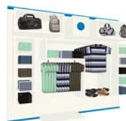
SECTEUR HABILLEMENT / TEXTILE