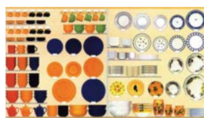
SECTEUR DÉCORATION / ART DE LA TABLE