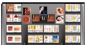
SECTEUR COSMÉTIQUE / LUXE

Voici des exemples d'utilisation pour quelques secteurs d'activité, les produits mis en valeur ci-dessous étant issus de la base Image de Klee Commerce :